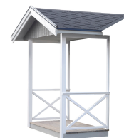
Modul Farstukvist 2,3

Mått 30 x 20. Observera att skjutdörrrens bredd motsvarar tre vanlig moduler. Kan endast placeras på gaveln. Art.nr. 5097