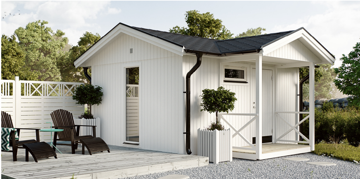
Friggeboden levereras obehandlad och kan vara extrautrustad

Rymlig friggebod med stor valfrihet. I grundsatsen ingår 14 stycken väggmoduler, som kan bytas ut mot valfritt antal fönster- och dörrmoduler och placeras var du vill.