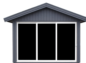
Modul Skjutdörrsparti 3-delat

Mått 30 x 20. Observera att skjutdörrrens bredd motsvarar tre vanlig moduler. Kan endast placeras på gaveln. Art.nr. 5097